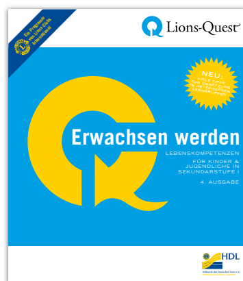
Abb. 2: Die Materialsammlung „Erwachsen werden“ in der vierten völlig überarbeiteten Fassung.

In den 1970er-Jahren wurde das Programm von der unabhängigen amerikanischen Stiftung „Quest International“ (Quest, engl. = Suche, Streben) unter dem Namen „Skills for Adolescence“ entwickelt und wird seit 1984 in Kooperation mit Lions Clubs International in heute mehr als 50 Ländern weltweit eingesetzt. In Deutschland wurde das Programm unter dem Namen Lions-Quest „Erwachsen werden“ erstmals 1994 in einer provisorischen Fassung angeboten. Das Autorenteam, Ellen und Heiner Wilms, arbeitet seitdem im Auftrag von HDL kontinuierlich an der Entwicklung des Programms. Seit 2007 liegt die dritte, vollständig überarbeitete Ausgabe der Materialsammlung mit Planungshilfen und Kopiervorlagen für den Unterricht vor, in der die Erfahrungen der deutschen Schulen aus der mehrjährigen Arbeit mit dem Programm eingearbeitet wurden. Die vierte Ausgabe mit vielen neuen Tipps für den Umgang