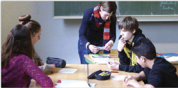
Abb. 2: Geteilte Meinungen in den Gruppen.