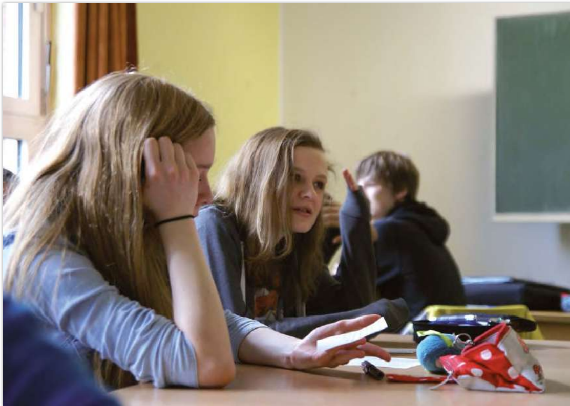
Abb. 2: Kritisches Denken und eigenverantwortliches Handeln üben – dafür ist die Schule ein idealer Ort.

wortliche und realistische Formulierung und Verfolgung von Zielen, einen konstruktiven Umgang mit Problemen in Stresssituationen und um die unter heutigen Bedingungen zunehmend wichtigere Kompetenz des Zeitmanagements. Der letzte Schwerpunkt in diesem Modul schließlich widmet sich den Kompetenzen kritisches Denken und eigenverantwortlicher Entscheidungs- und Handlungsfähigkeit. Gerade für ältere Jugendliche und junge Erwachsene werden diese persönlichen Kompetenzen immer wichtiger, weil sie zunehmend vor der Herausforderung stehen, Lebensaufgaben bewältigen zu müssen, die mit wichtigen Entscheidungen (zum Beispiel Partnerwahl, Ausbildungsweg, berufliche Orientierung, Gründung eigenen Haushalts) einhergehen. Vor dem Hintergrund einer zunehmenden medialen „Informationsüberflutung“ ist die Kompetenz, Informationen zu verarbeiten, zu sortieren, vertrauenswürdige von weniger vertrauenswürdigen Informationen zu unterscheiden, Argu-