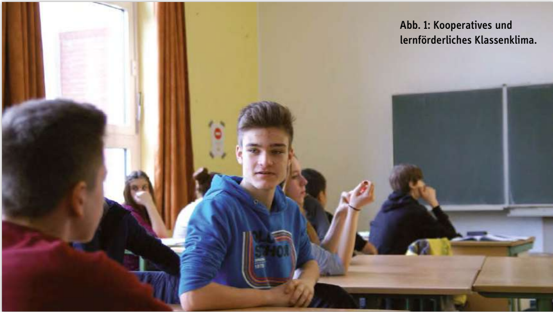
Abb. 1: Kooperatives und lernförderliches Klassenklima.