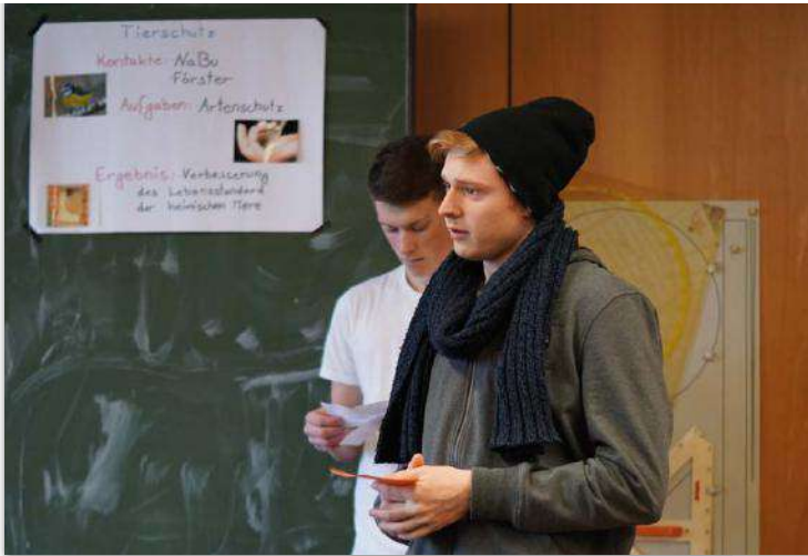
Abb. 2: Vorstellung des Projektes „Abfallbeseitigung“ im Seminarfach.

sich selbst zu reflektieren, dass sie Selbstbewusstsein und Selbstwertgefühl haben – weil dies unter anderem mit Bausteinen aus LQ EH entwickelt wurde. Und sie haben gelernt, Hilfe in Anspruch nehmen zu können. Sie haben keine Verlustängste und halten sich nicht für schwach, wenn sie jemanden um Hilfe bitte.“