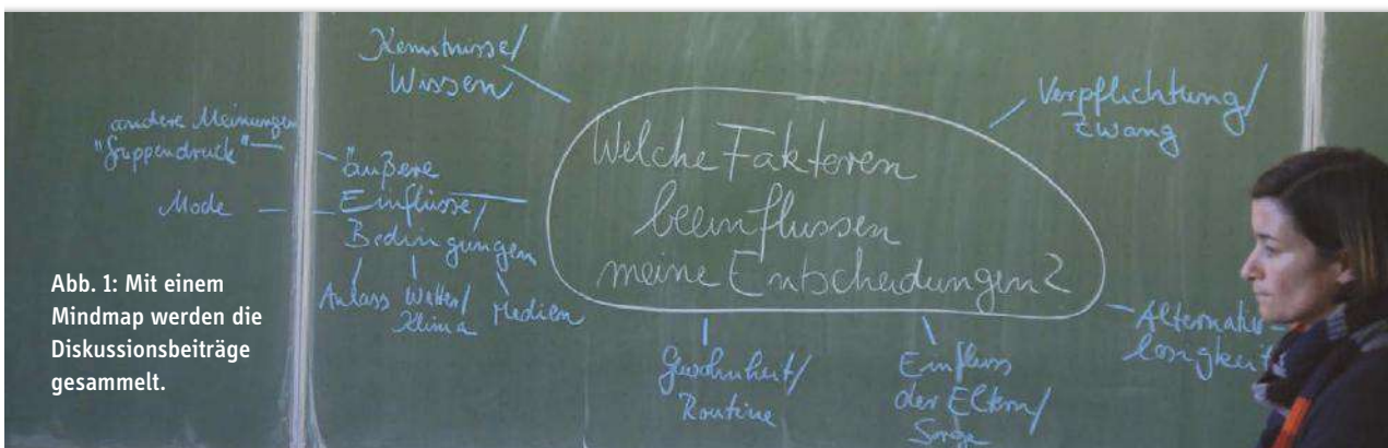
Abb. 1: Mit einem Mindmap werden die Diskussionsbeiträge gesammelt.

Es fällt auf, dass das Klassenklima recht entspannt und die Motivation der Schüler sehr hoch ist – und das in einer neunten Klasse, mit Schülern, die mitten in der Pubertät sind.